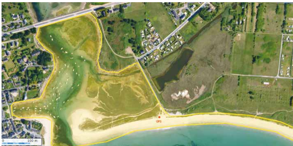
Périmètre initial de l'étude

« Cette étude a permis de mettre en évidence des modifications, visibles quoique d'amplitude modérée, des végétations des vasières de schorre et de slikke, suite à l'approfondissement des nouveaux chenaux créés par le percement de la digue et une très faible incidence des travaux sur la structure des végétations et la composition floristique des milieux supratidaux (qui ne subissent pas l'influence directe des