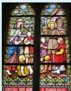
Vitrail, église de Plobannaec

De saint Alour qui est le patron de la paroisse de Plobannaec, on ne sait pas grand-chose. Son nom apparaît dans une liste épiscopale comme étant le troisième évêque de Quimper, ce qui nous ramène au moins un siècle et demi ou deux après Briec. La tradition lui attribue un parcours comparable à celui