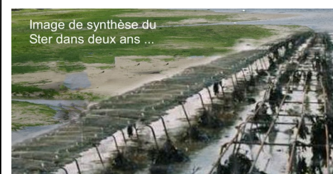
Image de synthèse du Ster dans deux ans ...

Ce projet n'est pas économiquement viable selon l'avis général partagé par les professionnels consultés, compte tenu du faible niveau d'eau du Ster. D'autre part, ce projet condamnait le Ster par les obstacles constitués de piquets, structures en fer et murets de parcage des palourdes, autant de freins à l'écoulement des eaux, des sables et sédiments dans l'unique chenal. Les marées n'auraient pu remonter jusqu'en haut du Ster.